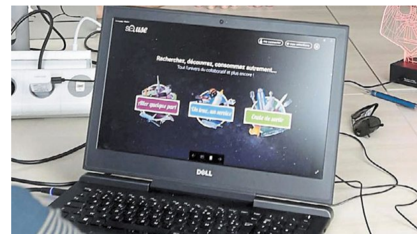
SoUse mise sur « les marques blanches ».