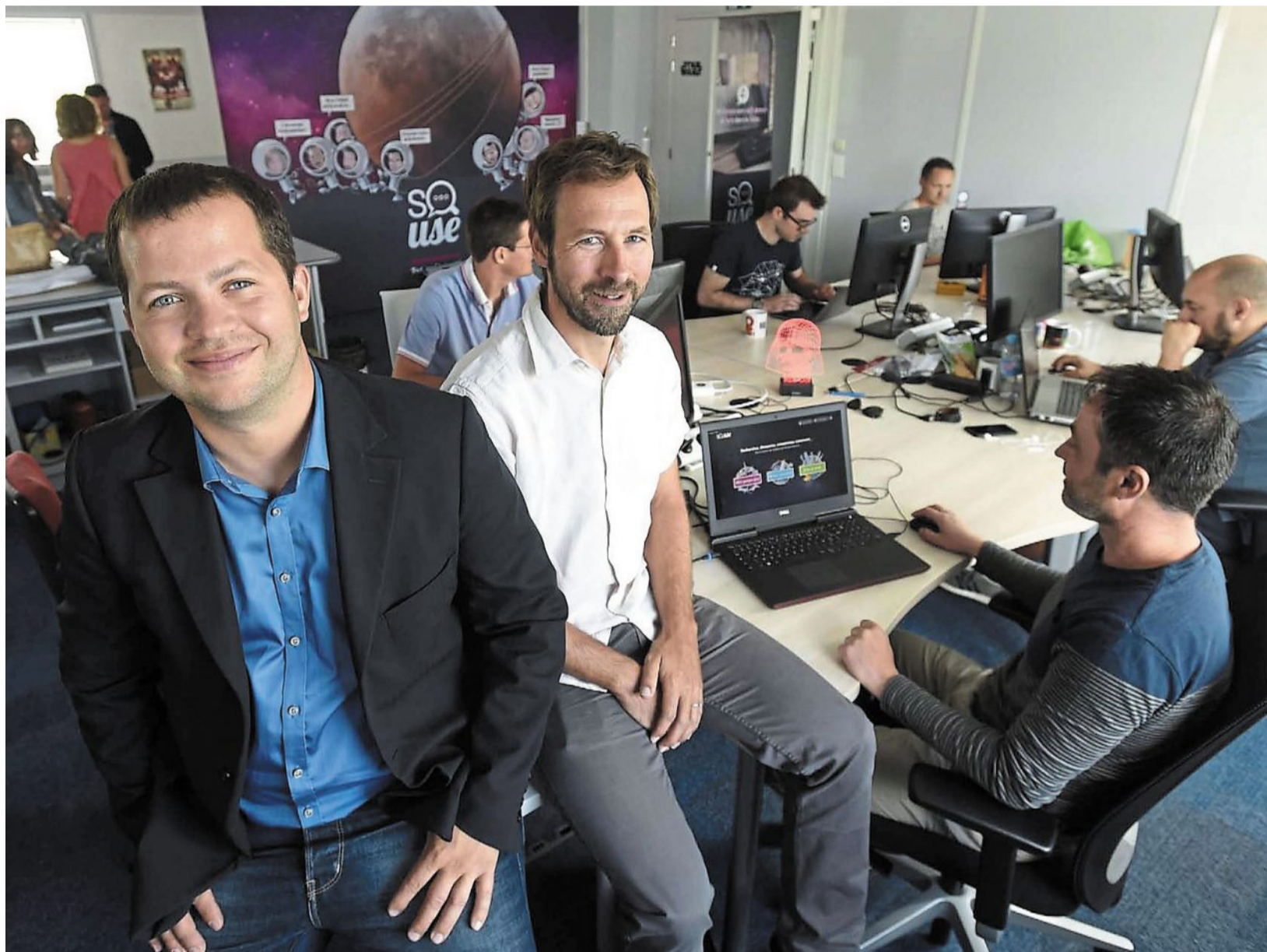
Une partie de l'équipe SoUse s'est envolée samedi pour assister au CES qui se déroule de demain à vendredi à Las Vegas.

L'équipe décide alors de refonder l'interface du site. Auparavant, l'utilisa-